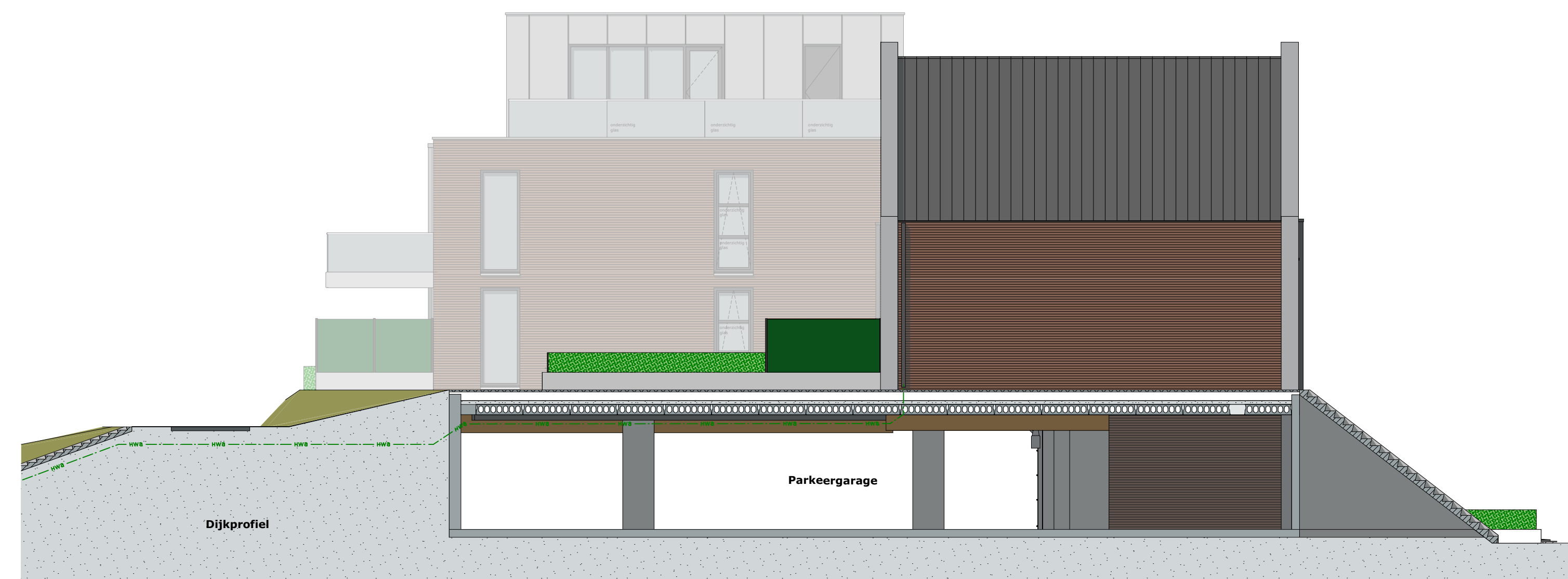
WESTGEVEL D 1:100