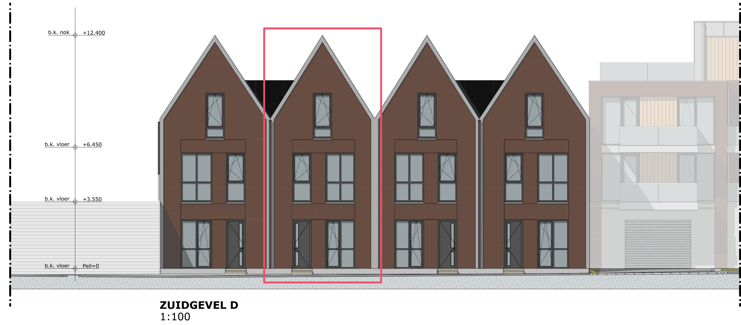
ZUIDGEVEL D 1:100