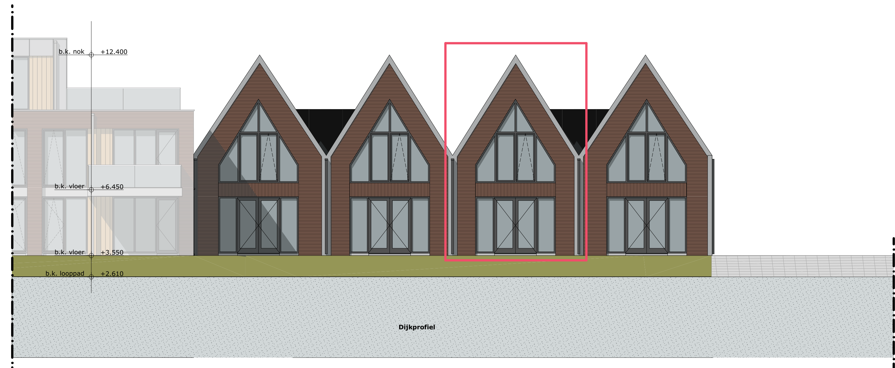
NOORDGEVEL D 1:100