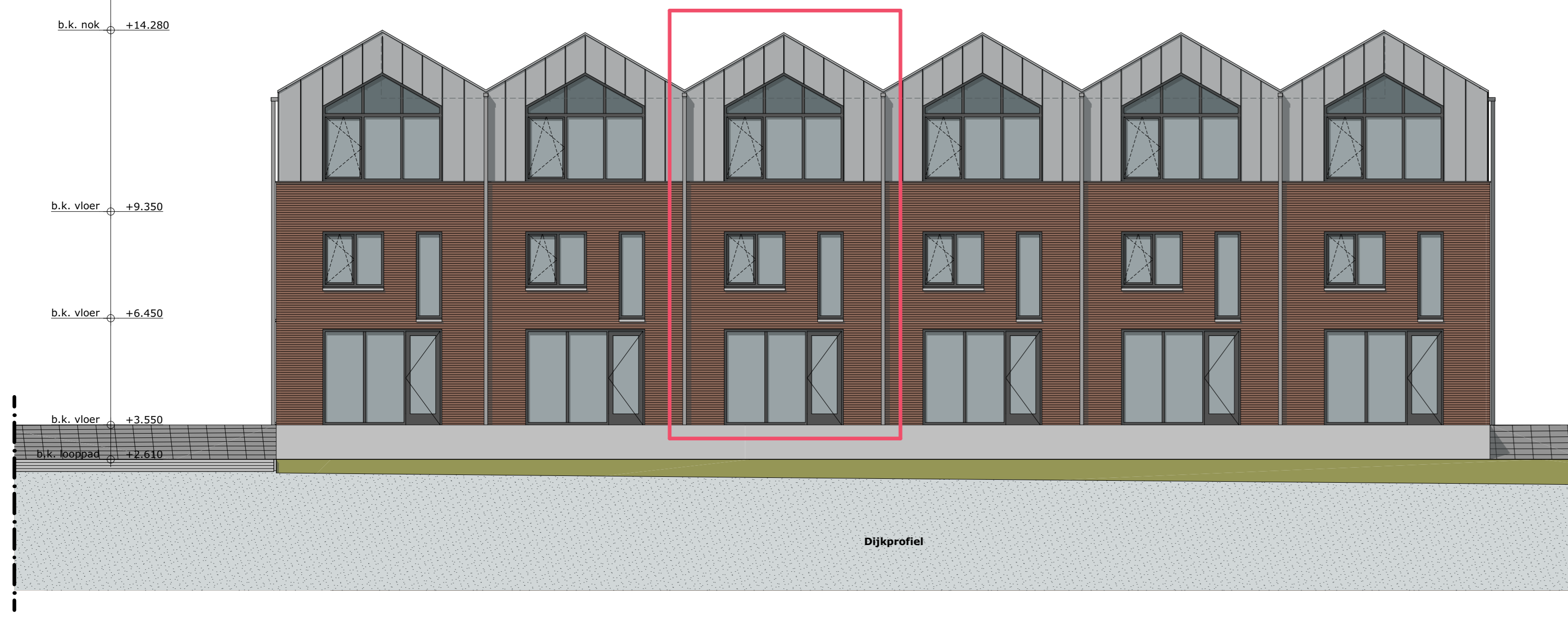
NOORDGEVEL B 1:100