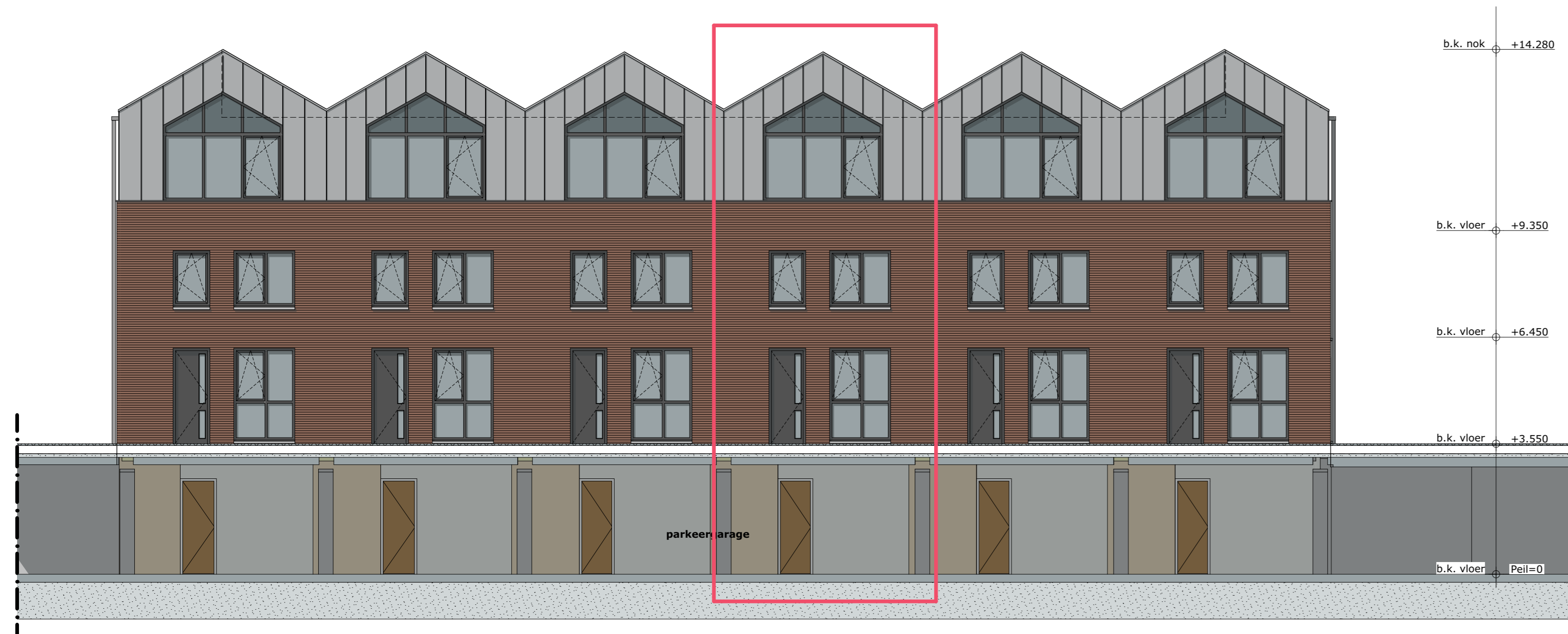
ZUIDGEVEL B 1:100